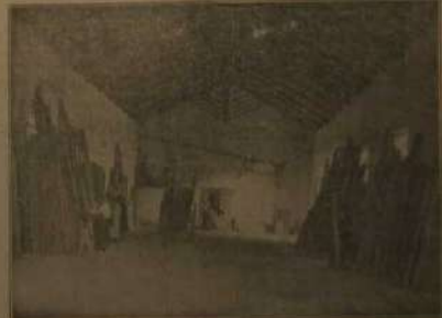
Uno de los almacenes para el acueducto de maderas