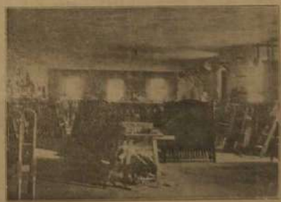
Departamento del pulimento

El personal de fabricas que le integra, merecen especiales mención, desde la ejecución del artículo, por inteligencia y demencia, se se tiene en cuenta la variedad de modelos de gusto moderno y acabado acabado. Esta casa, en la actualidad, hace un giro anual de un millón de pesos aproximadamente, cifra que a juzgar por el gran trabajo que en esta forma época regularmente está desarrollado.