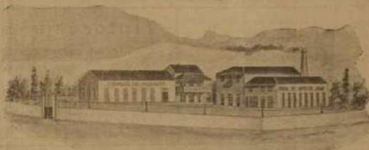
Vista general del edificio fábrica