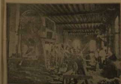
Sala de máquinas

En la actualidad esta fabricación cuenta con personal hábil y competente para su dirección y desenvolvimiento. Como apodado figura nuestro muy querido y simpático amigo