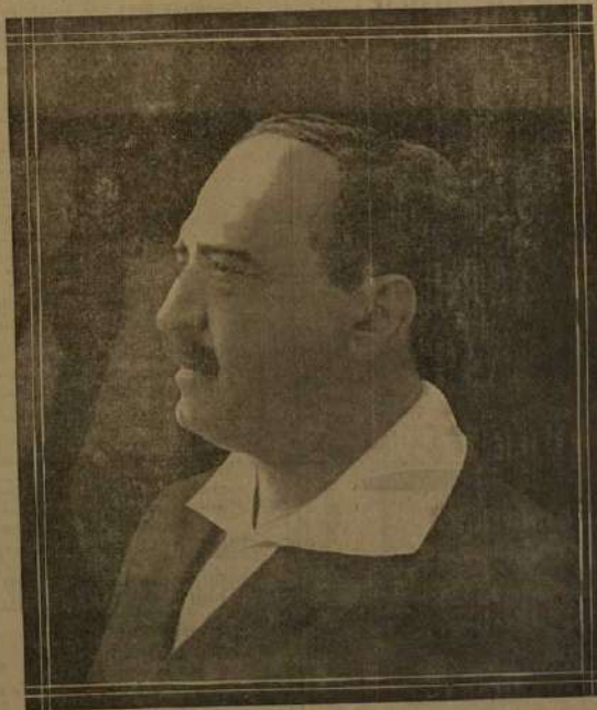
Don Vicente Blasco Ibañeta, el gran novelista fallecido en Menton el 28 de enero de 1928.