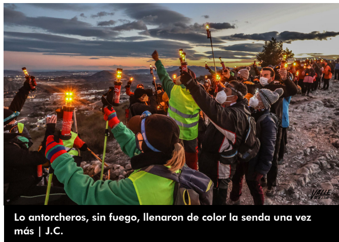
Lo antorcheros, sin fuego, llenaron de color la senda una vez más

La bajada de antorchas cumple 59 años y se celebra de forma ininterrumpida gracias a la iniciativa de los montañeros del Centro Excursionista Eldense.