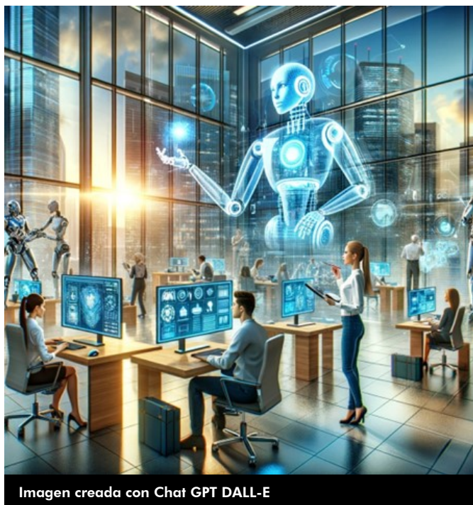
Imagen creada con Chat GPT DALL-E

Desgraciadamente, acabamos de salir de un momento histórico, el de la tercera revolución industrial que trajo de la mano la informática, del que no hemos salido airosos. No hemos sido capaces de superar el status de usuarios encapsulados en ignorancia. Han surgido iniciativas de éxito que han explotado justamente la distancia a la que nos hemos situado de la tecnología, conformándonos con los resultados que ofrecían. Han sido pocos, otros, los que se han beneficiado de los avances. Un progreso ficticio nos ha nublado la visión en la que el desarrollo no ha traído de la mano el progreso que podría haber facilitado. Eso nos ha llevado a que nuestro nivel de cualificación en estos momentos es escaso, para lo que requieren las circunstancias.