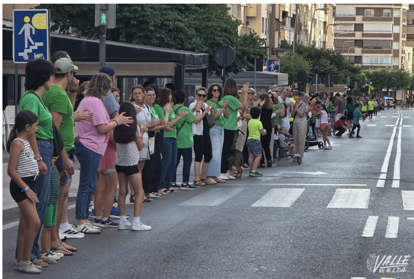
Han llegado del inicio al final de la Gran Avenida | Valle de Elda.

Docentes y familias han participado esta tarde en una cadena humana en defensa de la educación pública y como muestra de agradecimiento por el apoyo recibido durante las movilizaciones del profesorado de la Comunidad Valenciana. Este es el último acto organizado con motivo de la huelga docente. Tras un mes, el profesorado ha decidido suspender temporalmente la huelga hasta septiembre mientras continúan las negociaciones con Conselleria. Han llegado del principio a fin de la Gran Avenida.