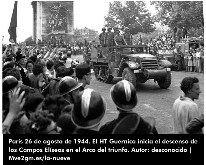
París 26 de agosto de 1944. El HT Guernica inicia el descenso de los Campos Elíseos en el Arco del triunfo.