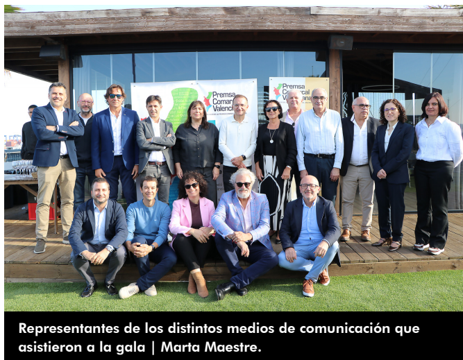
Representantes de los distintos medios de comunicación que asistieron a la gala | Marta Maestre.

Durante el transcurso del acto, se recordaba el origen de la entidad, que quedó formalmente constituida en noviembre de 2015 en Alcoi y los primeros pasos, pero también la evolución de Prensa Comarcal Valenciana a lo largo de esta década, en la que de manera periódica los medios que forman parte de la asociación han desarrollado acciones conjuntas, como la edición de publicaciones y anuarios, entrevistas a personalidades de diferentes ámbitos o jornadas de formación, entre otras.