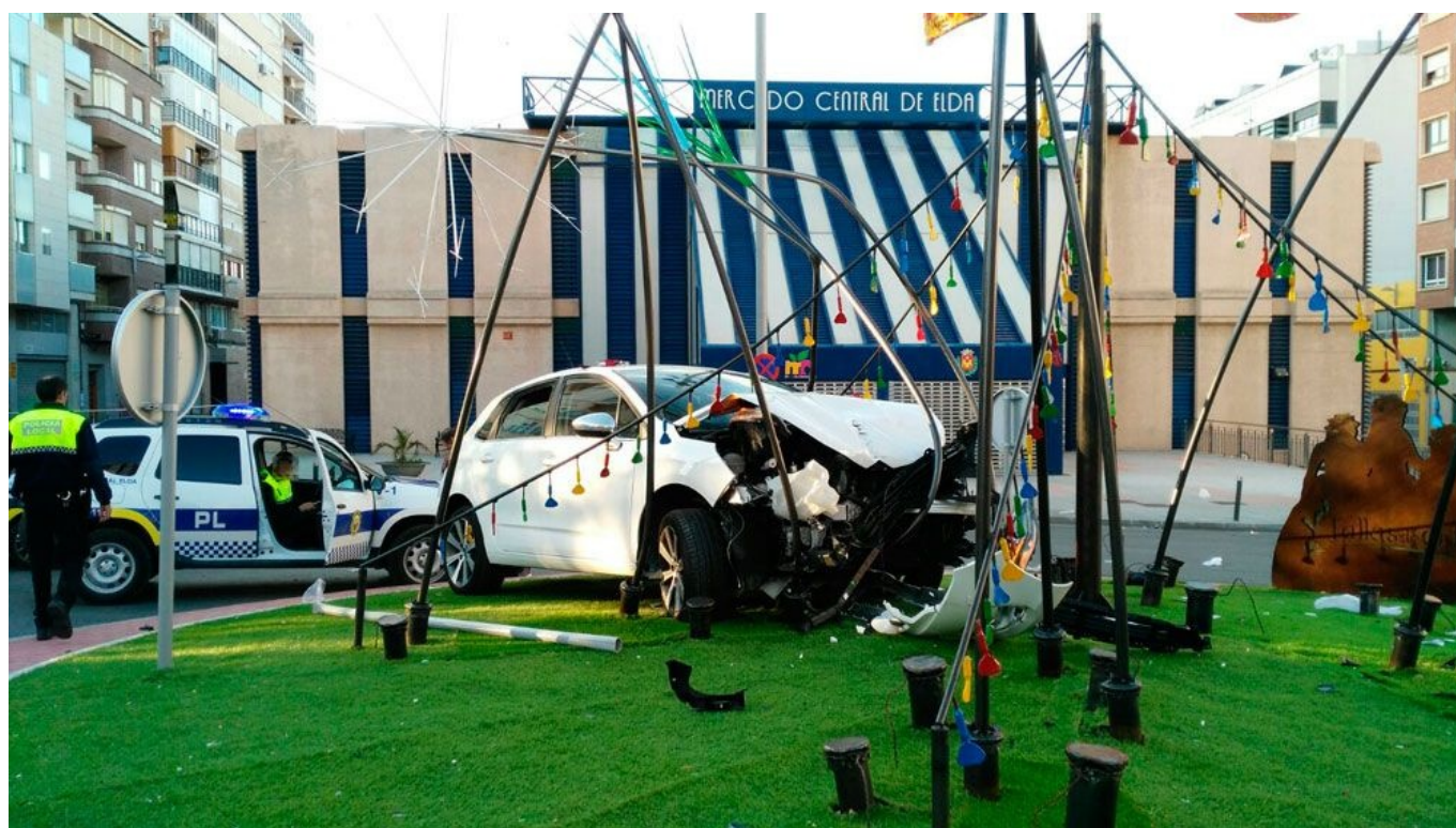
La rotonda ha sufrido daños en su estructura debido al choque.

La rotonda de las Fallas, situada frente al Mercado Central de Elda, ha sufrido desperfectos esta mañana cuando una conductora, pasadas las 8 horas, ha perdido el control de su vehículo y ha chocado contra el monumento en honor a las fiestas del fuego eldenses.