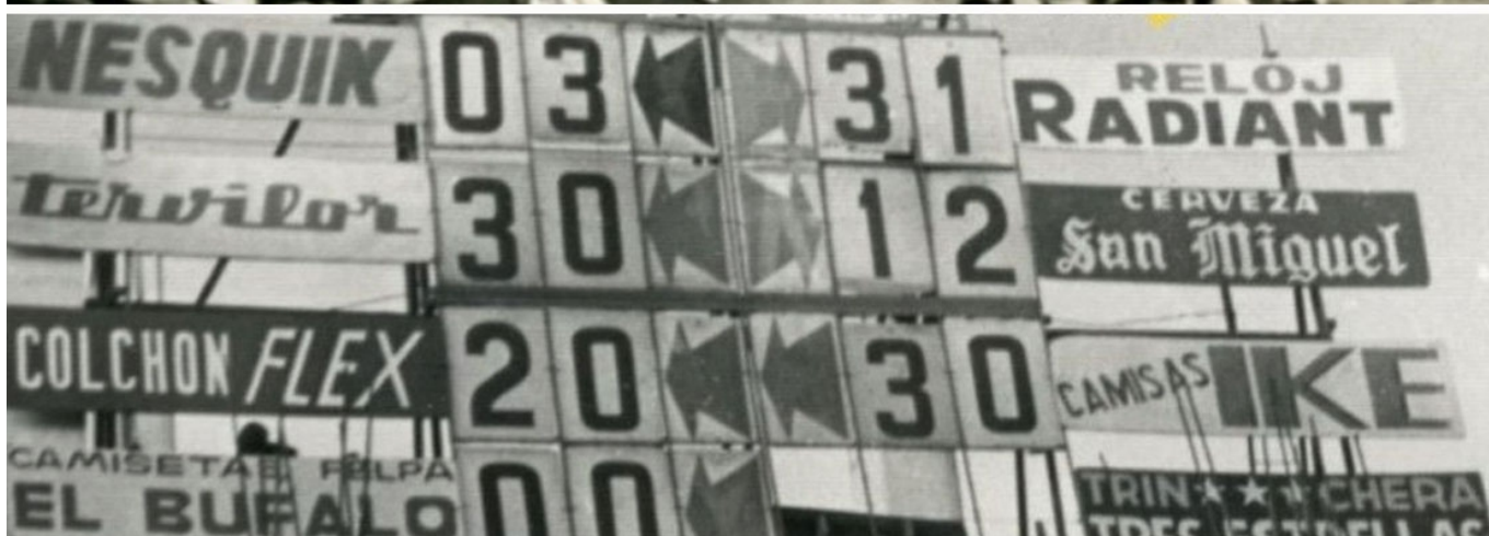
Arriba el primer marcador que se instaló en Elda en 1941. Abajo el Simultaneo Dardo de 1957 | Carlson.

El Eldense estrenó el lunes los videomarcadores instalados en el Nuevo Pepico Amat. Hasta llegar a esas pantallas electrónicas con tecnología led han transcurrido 82 largos años de evolución informativa hacia los aficionados al fútbol en Elda.