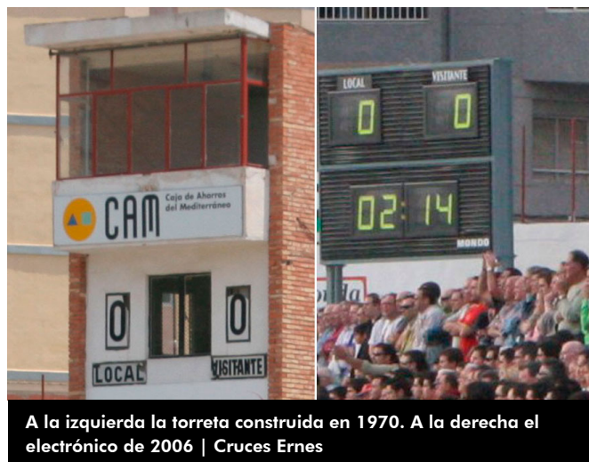
A la izquierda la torreta construida en 1970. A la derecha el electrónico de 2006

Aquel diminuto tanteador desapareció al construirse una torreta vertical en una esquina del Fondo Sur que se inauguró el 6 de septiembre de 1970 con el partido Eldense-Novelda (2-1), goles azulgranas de Ramón Soriano y Juan Ramón.