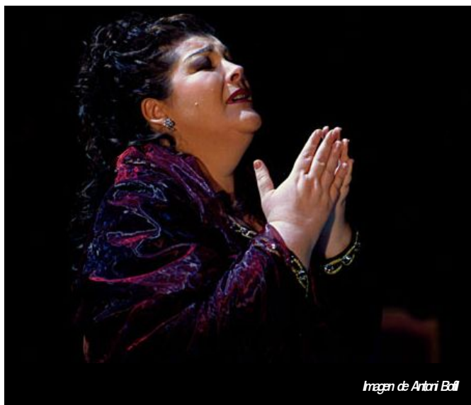
Imagen de Antoni Boíl

Las interpretaciones de Esteve son un tanto asépticas, si bien capaces de captar al público, en gran medida por la riqueza del instrumento (...) Resulta incomprensible que no haya realizado un solo trabajo en los estudios de grabación”.