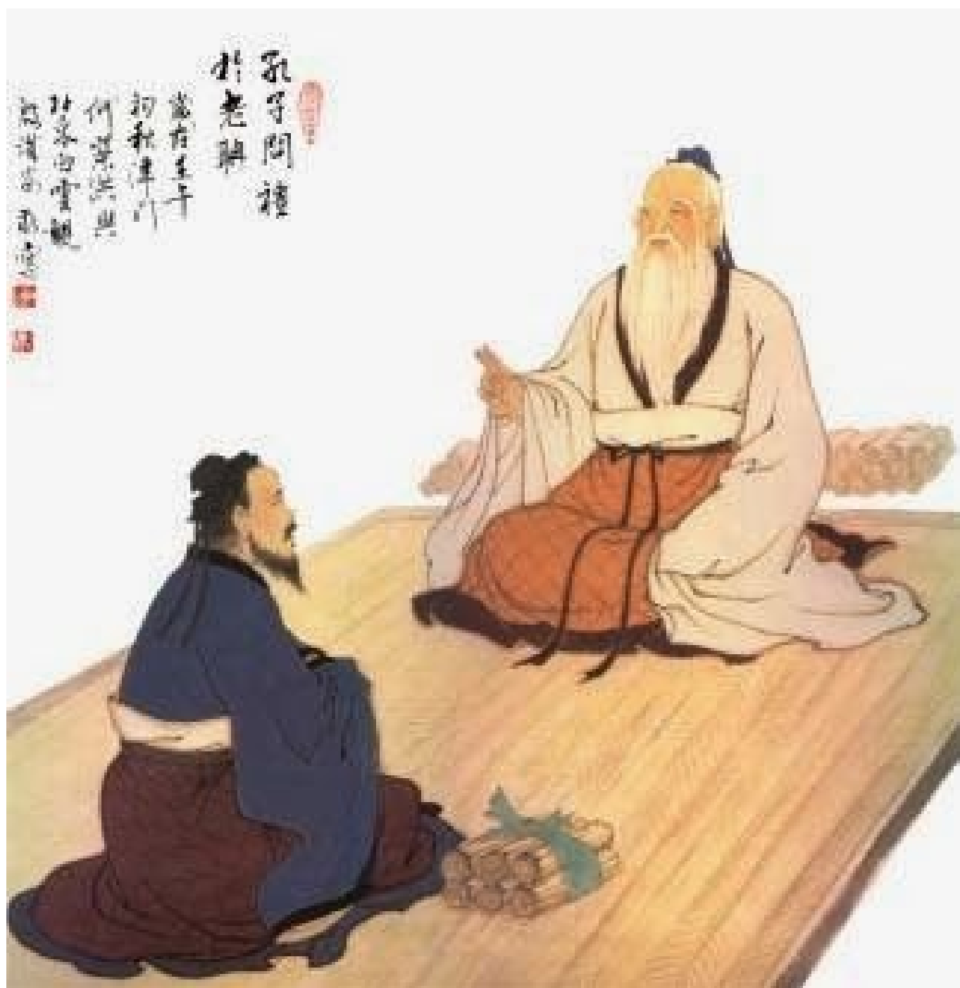
Lao Tse y Confucio