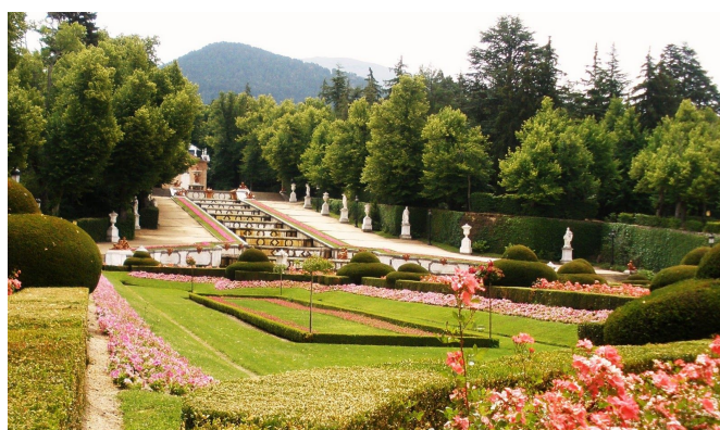
Dónde volveremos a construir el jardín de Epicuro