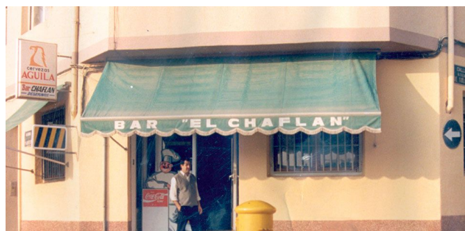
Sus inicios fueron en el bar El Chaflán ofreciendo comida tradicional.

Actualmente disponen de un local cerca del antiguo Chaflán, pero en unas instalaciones totalmente reformadas, amplias y luminosas, con tres cocinas, cuatro salas independientes y zona infantil. Su nueva decoración es moderna, acogedora y dispone de un aforo para mil personas.