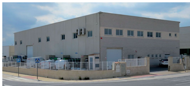
Actualmente la empresa se ubica en el polígono Finca Lacy.