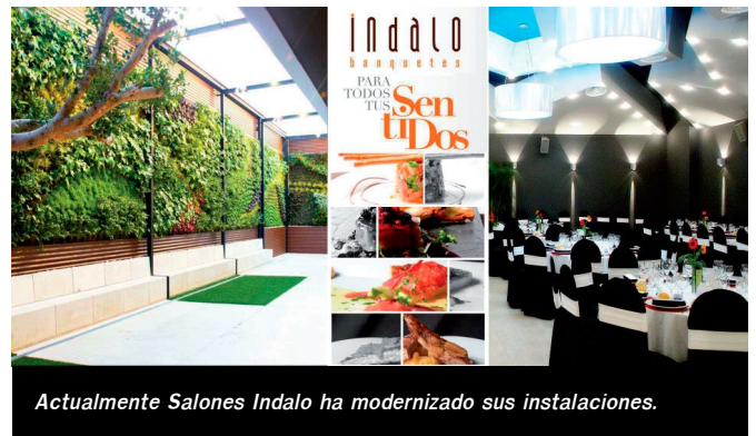
Actualmente Salones Indalo ha modernizado sus instalaciones.

Salones Indalo tiene su origen en 1983 cuando era un bar de un barrio modesto en la localidad de Petrer. Entonces disponía solo de diez mesas y una pequeña cocina tradicional. Con el paso del tiempo, la familia vio la posibilidad de gestionar un salón de banquetes, conocido como El Chaflán, donde comenzaron a servir banquetes, era un local ubicado en la zona de la Foia, que dirigieron durante diez años.