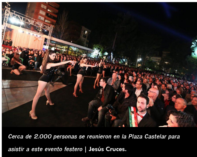
Cerca de 2.000 personas se reunieron en la Plaza Castelar para asistir a este evento festero

cruz. En la gala también se presentó la edición número 72 de la revista MyC 2016.