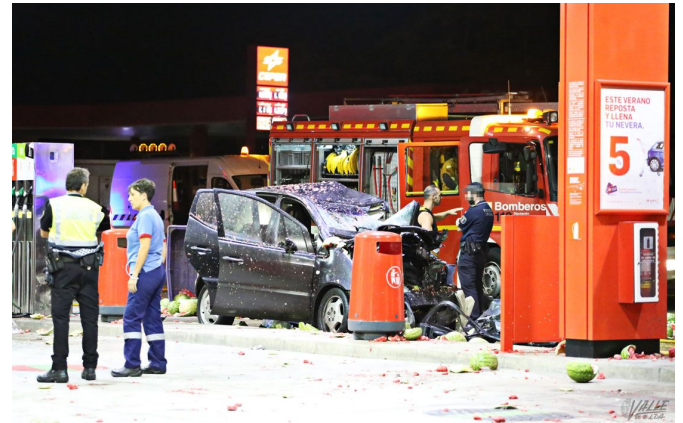
El camión arrolló a cuatro vehículos | Jesús Cruces.

Debido a la gravedad del accidente, al lugar de los hechos trasladaron varias patrullas de la Policía Local de Petrer así como de la Guardia Civil de Tráfico, Bomberos, Cruz Roja, cuatro ambulancias SAMU, tres de soporte vital básico y una TNA. Además, varios compañeros del SAMU al pasar por el lugar de los hechos se sumaron al dispositivo para ayudar en todo lo posible.