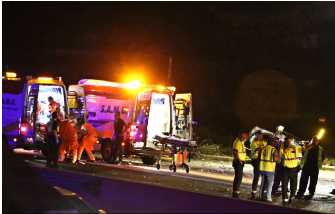
Cinco ambulancias participaron en este suceso