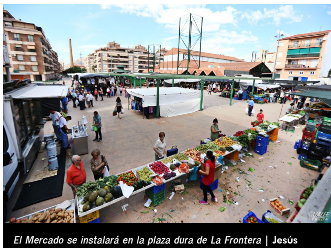
El Mercado se instalará en la plaza dura de La Frontera | Jesús