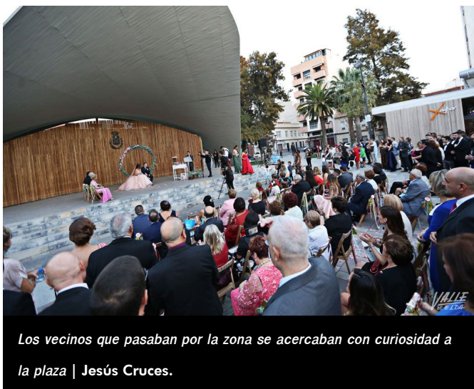
Los vecinos que pasaban por la zona se acercaban con curiosidad a la plaza | Jesús Cruces.

La pareja confió en la empresa Seven Weddings para organizar la ceremonia, que se hizo cargo de la decoración del escenario, la colocación y adorno floral de las sillas, la megafonía y el vehículo para traer a los novios, un antiguo Wolskwagen Beetle. La amplia plantilla de esta firma de organización de eventos estuvo atenta a los detalles en todo momento.