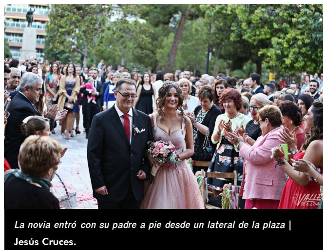
La novia entró con su padre a pie desde un lateral de la plaza