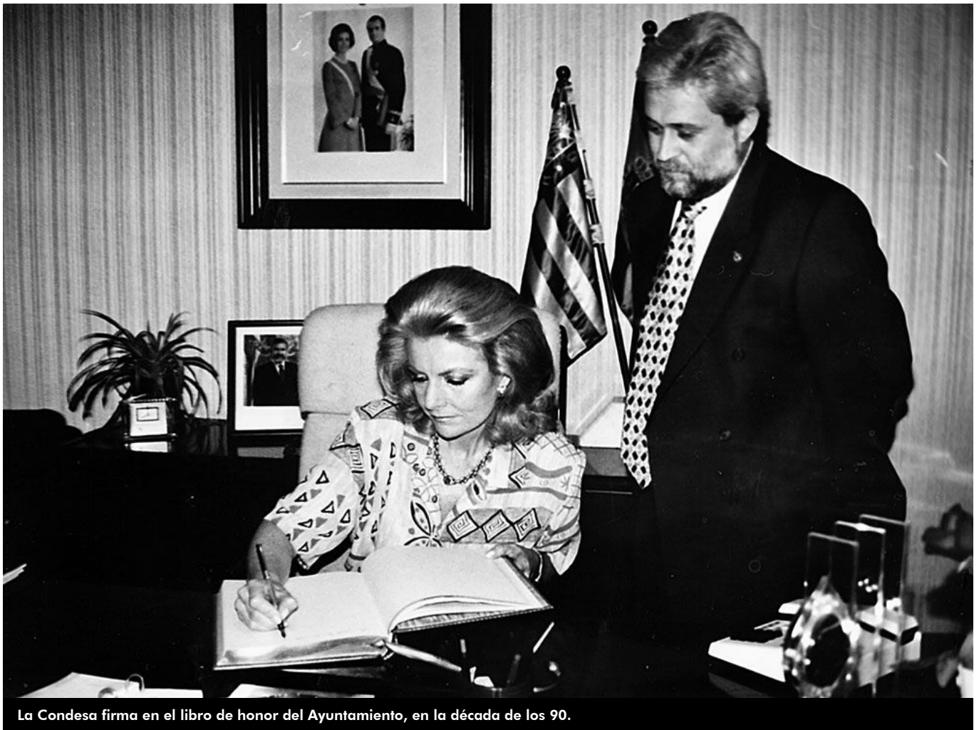
La Condesa firma en el libro de honor del Ayuntamiento, en la década de los 90.

En el transcurso de la década de los años cuarenta del pasado siglo, España vivía una situación total de posguerra marcada por las desigualdades sociales. Mientras unos subsistían con escasos medios, otros más afortunados disfrutaban de una vida marcada por el lujo y un modus vivendi envidiable que no parecía el apropiado en un país casi arrasado.