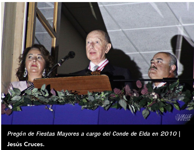
Pregón de Fiestas Mayores a cargo del Conde de Elda en 2010 |

Personas de la realeza, ministros, embajadores, notables de las artes y las letras, además de "los más de lo más" escogido de nuestro país, eran objeto de la gran hospitalidad de los Condes de Elda en su "Baile de los de Elda".