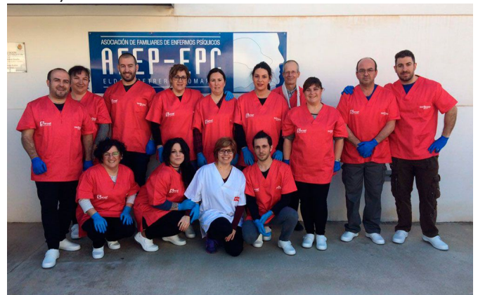
Promoción limpieza Superficies 2016.