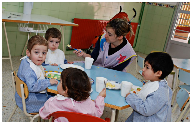
En Serlicoop se enseña a las trabajadoras a cuidar con la máxima

trato a sus clientes, así como por una continua innovación en sus servicios y por su compromiso con el entorno.