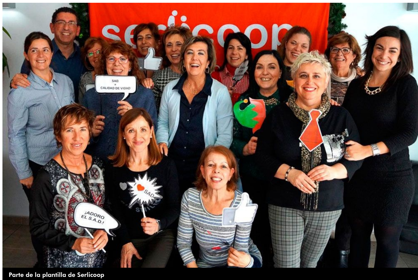
Parte de la plantilla de Serlicoop

La empresa eldense Serlicoop cumple este año su 25 aniversario demostrando la fuerza de un equipo en femenino , pues más del 90% de la empresa está formada por mujeres , que a diario se esfuerzan para poder conciliar, corresponder y superarse. Esta misma semana celebran que llevan un cuarto de siglo de trabajo incansable y mucho esfuerzo . Serlicoop puede afirmar con orgullo que han formado a más de 3.000 personas , así como que cuentan con una plantilla compuesta por 160 personas que alcanza las 200 en épocas estivales.