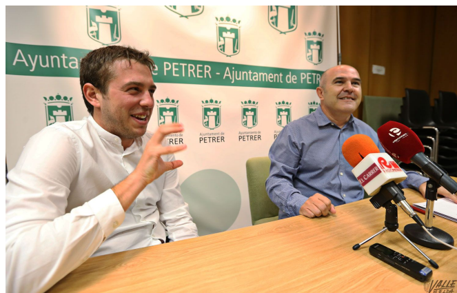
Morcillo y Poveda se han mostrado satisfechos al anunciar esta reducción | Jesús Cruces.

a ser de 50 euros en todos los casos , cuando antes era el 50% del coste de la tasa.