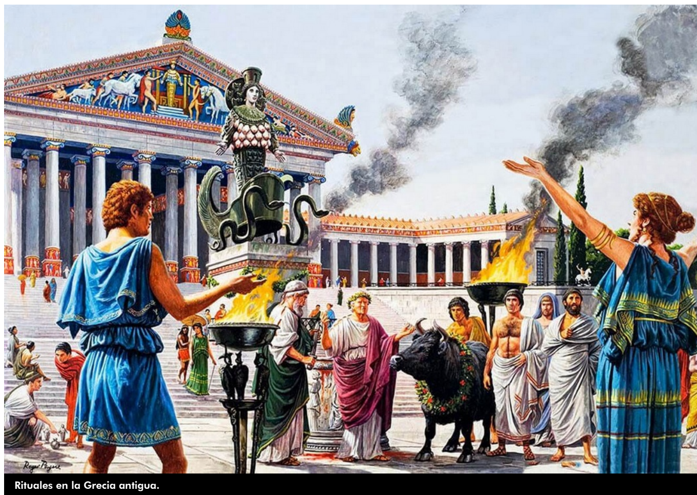
Rituales en la Grecia antigua.

Los griegos usaron la sandalia de cuero y la bota, para los hombres llegaba hasta la pantorrilla con aplicaciones de piezas metálicas, distinguían un quiebre diferente para el pie izquierdo y derecho.