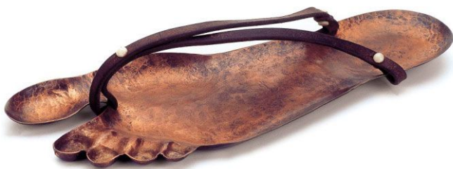
Calzado atribuido a los griegos consistente en una plancha de cobre con la forma de la planta del pie y sujeto con correas al empeine. Museo del Calzado (Reproducción)

A partir del año 600 a.C., las mujeres griegas de la clase alta, adoptaron un calzado de cuero empleando pieles con los colores de moda que eran el blanco y el rojo. En los tiempos más antiguos apenas se empleaban calzados, iban descalzos y sólo posteriormente comenzaron a emplear zapatos, aunque en el interior de sus casas permanecían descalzos.