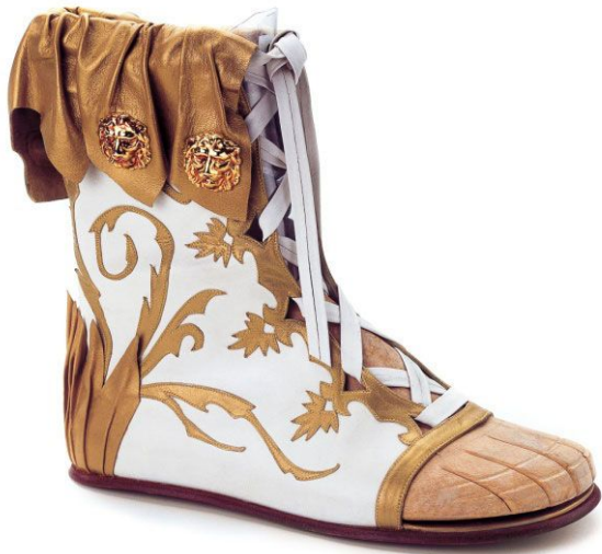
Botín griego. Museo del Calzado (Reproducción)

A partir del año 600 a.C., las mujeres griegas de la clase alta, adoptaron un calzado de cuero empleando pieles con los colores de moda que eran el blanco y el rojo. En los tiempos más antiguos apenas se empleaban calzados, iban descalzos y sólo posteriormente comenzaron a emplear zapatos, aunque en el interior de sus casas permanecían descalzos.