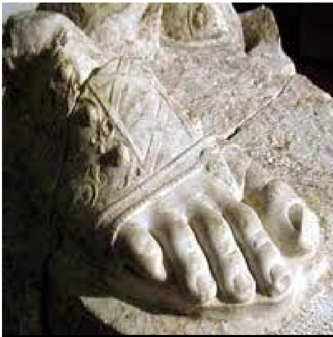
Persikai, detalle de escultura.

En la época clásica los griegos calzaron una sandalia llamada "persikai" que era muy cómoda de calzar y la usaban las personas de edad, el nombre lo tomaba de su origen en Persia.