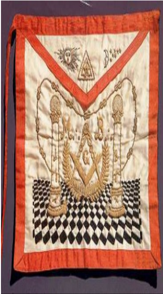
Mandil utilizado en las ceremonias masónicas.