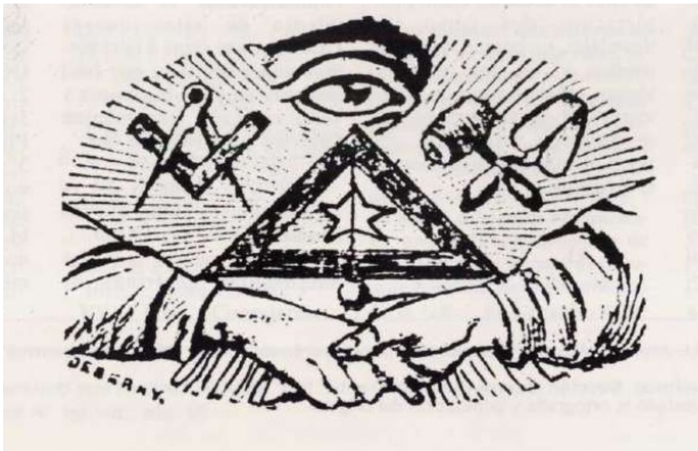
Anagrama de la Logia Fidelísima, de Elda (1886).

Hoy hace 132 años que se constituyó la primera logia masónica de nuestra ciudad. Un 4 de abril de 1886 una serie de prohombres eldenses constituyeron logia Fidelísima, nº 335 sujeta a los auspicios del Supremo Grande Oriente de España , caracterizado por una tendencia más democrática y liberal que el resto de obediencias masónicas existentes en la segunda mitad del siglo XIX en el ámbito hispano.