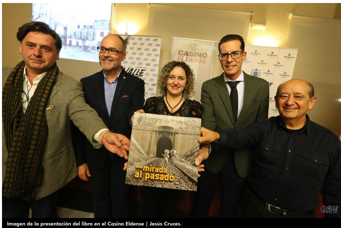
Imagen de la presentación del libro en el Casino Eldense | Jesús Cruces.

Debido al éxito del libro de fotografías Una mirada al pasado , publicado por el semanario Valle de Elda , la empresa Ediciones Notivalle ha decidido lanzar una segunda edición de este libro , que estará lista en los kioscos y librerías en las próximas semanas.