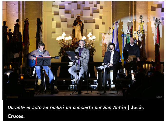
Durante el acto se realizó un concierto por San Antón | Jesús Cruces.

La imagen permanecerá en la parroquia de Santa Ana hasta el próximo sábado 26 de enero, cuando a las 18 horas tendrá lugar el Traslado de San Antón hacia su ermita en un acto que contará con los cargos de 2019 así como autoridades festeras y civiles. Pero antes, el viernes a las 20:30 horas también en la iglesia tendrá lugar un encuentro de tres generaciones (niños, adultos y mayores) bajo el título Pasado, presente y futuro con San Antón , que organiza la Mayordomía para que los más pequeños conozcan al santo y para homenajear la labor de cada generación en pro de la fiesta.