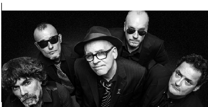
Hermano bebe, que la vida es breve, cantaba Siniestro Total.

Un Serrat que cantó a Machado y su "caminante no hay camino/ se hace camino al andar./ Al andar se hace el camino,/ y al volver la vista atrás/ se ve la senda que nunca/ se ha de volver a pisar", cima donde las haya del tema tratado, vinculado aquí a otro tópico, el del homo viator , la vida como viaje, como camino. Antes de Machado, los románticos también recogieron este motivo en composiciones que aludían a la decrepitud que la erosión del tiempo va dejando en nosotros y en el paisaje (bajo la influencia de poemas medievales o barrocos como el soneto A las ruinas de Itálica , de Francisco Medrano) o al paso del tiempo irreparable también para los enamorados , como en la Rima LIV de Bécquer: