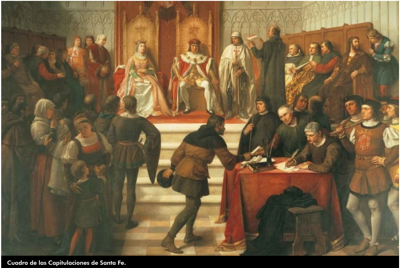
Cuadro de las Capitulaciones de Santa Fe.