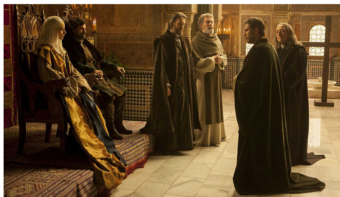
Secuencia de la serie "Isabel", emitida por RTVE, en la que los Reyes Católicos reciben a Cristóbal Colón para la firma de las Capitulaciones entre ambos que permitieron al marino arribar a las costas de las Indias.