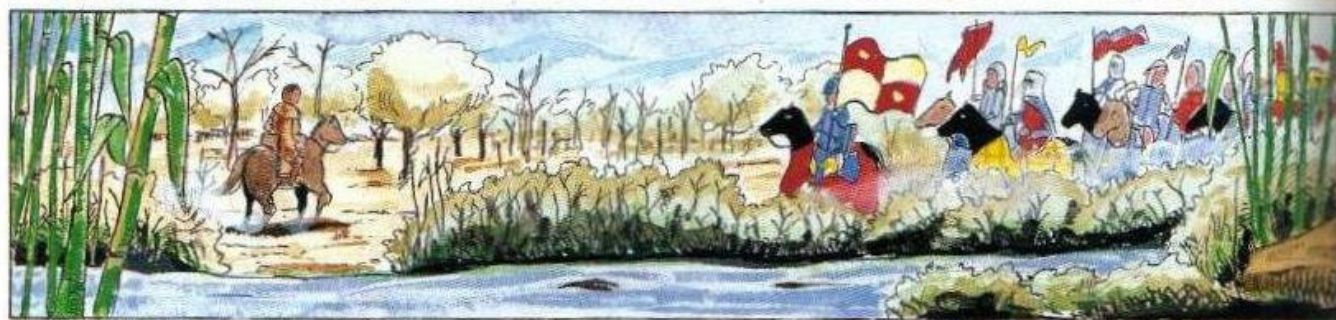
Recreación histórica de la llegada del infante Alfonso a la villa de Elda a finales de marzo de 1244.

Tras la firma del Tratado de Almisra , un 26 de marzo de 1244, entre Jaime I de Aragón y el infante don Alfonso , en nombre y representación de su padre Fernando III de Castilla y León , y una vez delimitada con precisión la frontera entre ambas coronas, el infante castellano inició el viaje hacia Murcia, sometiendo a su autoridad a todas las alquerías o núcleos andalusíes de la comarca del Medio Vinalopó. Una a una, todas fueron pactando el reconocimiento del rey de Castilla como nuevo señor, sometiéndose a su vasallaje. A cambio de conservar sus propiedades, su religión, su lengua, sus leyes y sus costumbres, cedían el castillo o fortaleza existente.