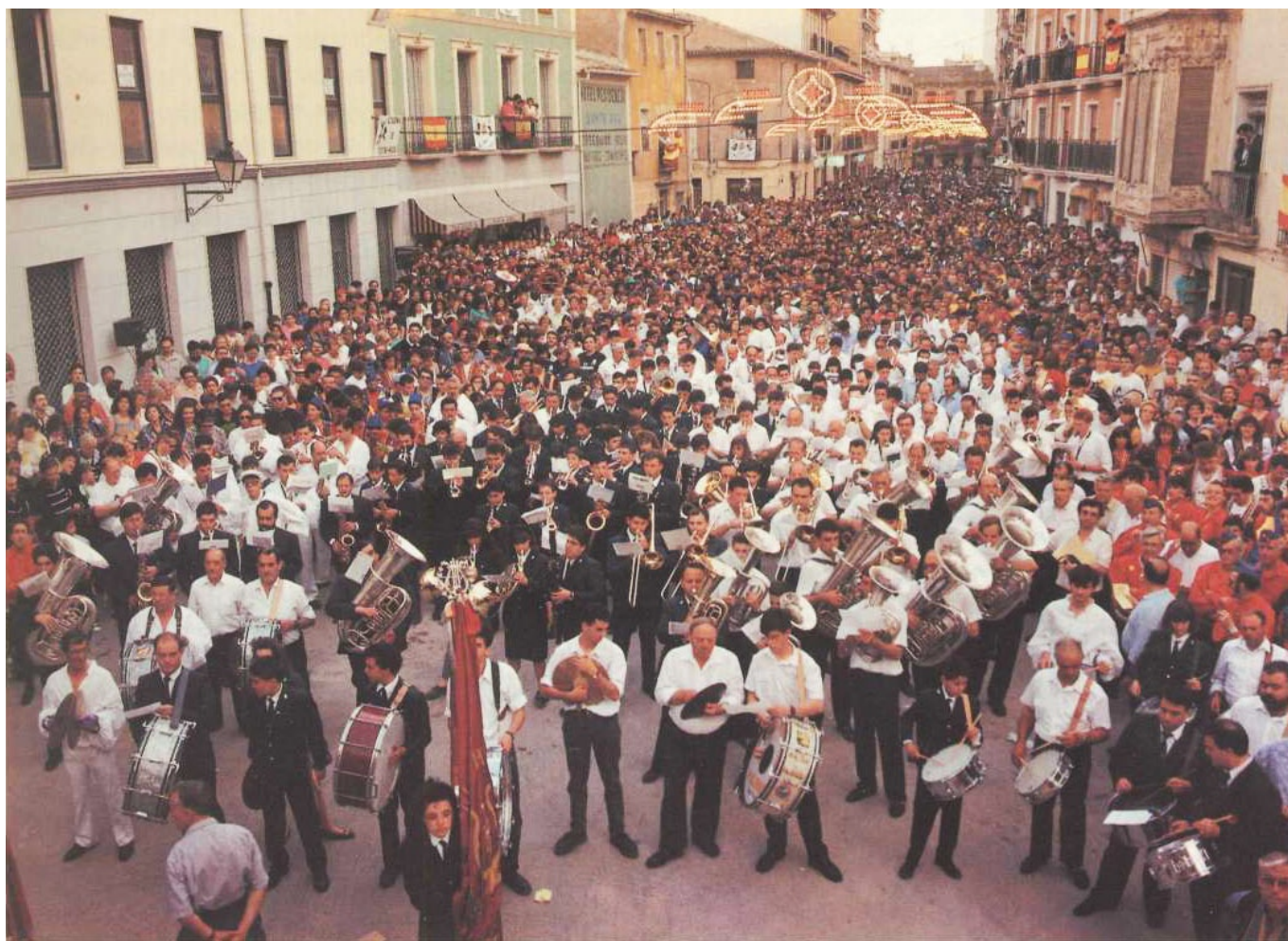
La bandas de música se preparan para interpretar el pasodoble Idella el jueves, 6 de junio de 1991.

Compuesto en 1983 por el prolífico maestro Miguel Villar y regalado al pueblo de Elda, el pasodoble Idella , icono musical de la fiesta de Moros y Cristianos de Elda, tardaría 8 años en alcanzar el protagonismo total y absoluto que cada jueves de moros adquiere durante la entrada de bandas de música. Será un martes, 4 de junio de hoy hace 29 años, cuando Idella fue dotada de letra para poder ser cantada como colofón a la entrada de bandas.