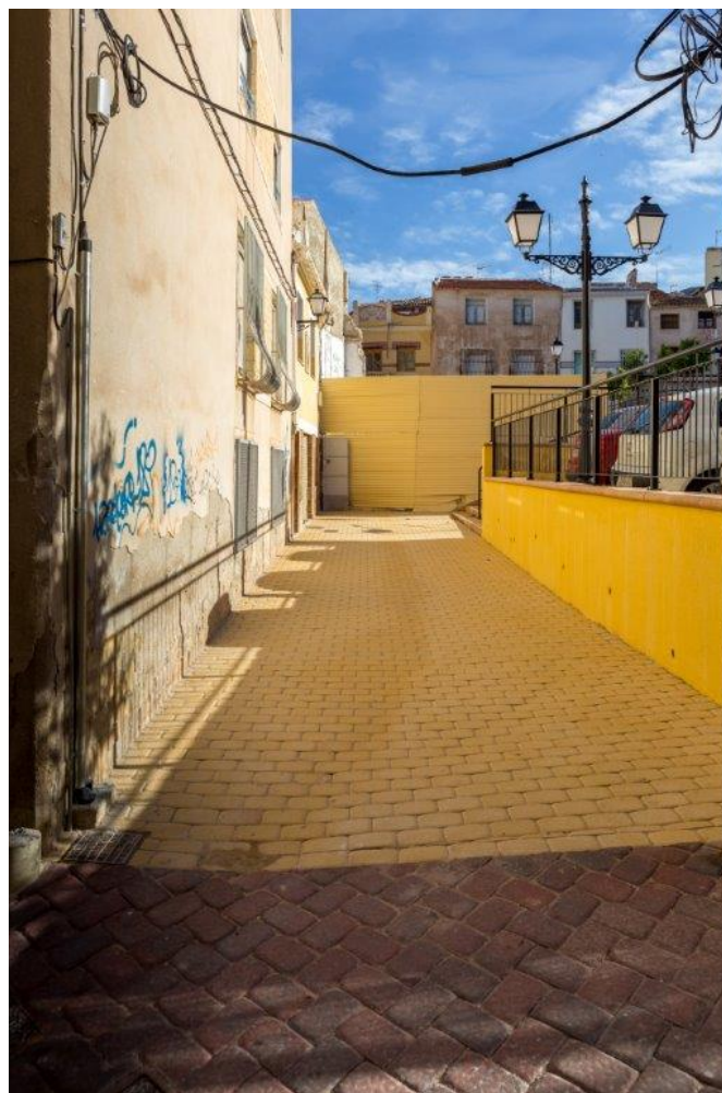
Imatge actual de la plaça de les Ànimes