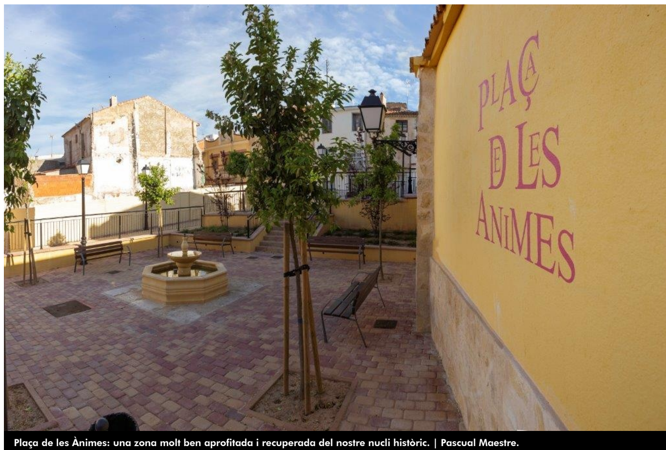
Plaça de les Ànimes: una zona molt ben aprofitada i recuperada del nostre nucli històric. | Pascual Maestre.

Aquest carrer, amb apel·latiu espiritual i religiós , ja que la societat clerical i tancada de l'Antic Règim agradava d'aquesta mena de noms per a denominar els carrers, és una xicoteta travessia que connecta els carrers Castelar i Numància , i està documentada des de l'any 1726 . Cal fer constar que és una de les poques vies públiques que ha conservat la seua denominació original fins a l'actualitat.