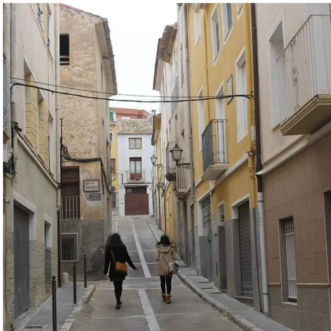
Confluència del carrer Ànimes amb el carrer Castelar | Pamela Bernabé,

En l'antiguitat, es considerava l'ànima més com un simulacre o fantasma del vivent que com a essència immortal de l'ésser humà, concepció que va arribar molt més tard. Aquest apel·latiu fa referència als esperits dels morts, a les ànimes que esperen la seua redempció en el purgatori. Amb la mort, l'ànima aspira a alliberar-se del cos que l'empresona per a tornar al seu origen diví. Durant molts segles, s'ha rendit culte a les ànimes dels morts. Segons la tradició cristiana, a través de les pregàries poden eixir del purgatori i pujar al cel.