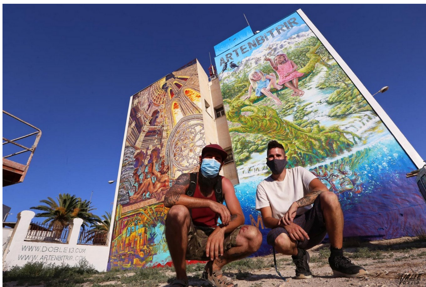
"Futuro: colapso y esperanza" es el nombre del mural que representa dos futuros, el que no quieren y el que sí.

Alrededor de 80 días y 375 litros de pintura ha costado la ejecución del proyecto "Futuro: colapso y esperanza", el llamativo mural de 320 metros cuadrados que decora la fachada de un edificio de la que fue el edificio Telefónica, en Petrer. Previamente, sus creadores invirtieron tres meses para idear la construcción del concepto y del diseño, de hecho, ya por octubre de 2019 comenzaron las solicitudes de permisos. Un proyecto que tenía previsto realizarse en un mes y medio aproximadamente para el evento de Artenbitrir 2020, que se suspendió, pero que, debido a las dificultades técnicas y la situación que ha vivido el