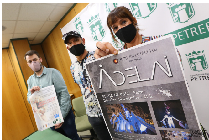
Imagen de la presentación.