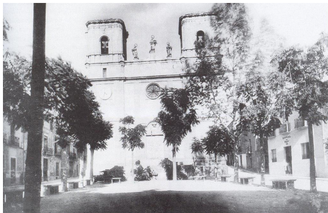
En la plaça de Baix tenían su residencia las familias más distinguidas de Petrer.