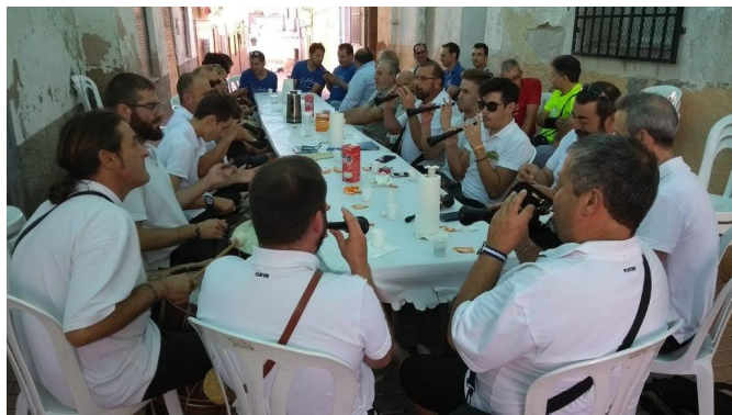
La Colla, des de el seus inicis, sempre ha esta present en totes les celebracions de Petrer. Després de la Desperetà, esmorzant en el carrer del Crist. Any 2017 | José Vicente Romero Ripoll.