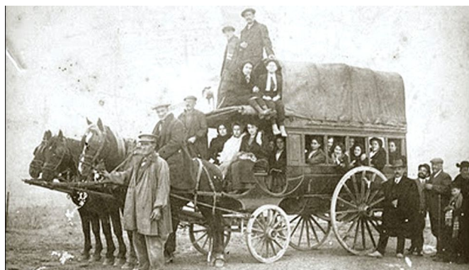
Carruaje de la compañía Diligencia del Poniente de España, que hacía el trayecto entre Oviedo y Madrid en el siglo XIX.

Para acabar con la inseguridad generada en los caminos y comunicaciones entre las capitales provinciales, ciudades y pueblos en marzo de 1844 fue creada la Guardia Civil , como cuerpo de seguridad pública profesional, de ámbito nacional y con un amplio despliegue territorial, que permitiera responder eficazmente a las necesidades de seguridad de la España de mediados del siglo XIX en pleno proceso de transformación entre aquella España del Antiguo Régimen y el nuevo estado liberal en el que la burguesía de las ciudades requería tranquilidad en la circulación de personas, mercancías y capitales.