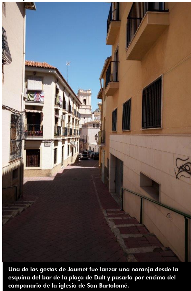
Una de las gestas de Jaumet fue lanzar una naranja desde la esquina del bar de la plaça de Dalt y pasarla por encima del campanario de la iglesia de San Bartolomé.

Jaumet murió el 10 de septiembre de 1915, a los 59 años de edad, después de haber ganado multitud de partidas y convertirse en una leyenda en el mundo de la pelota valenciana.