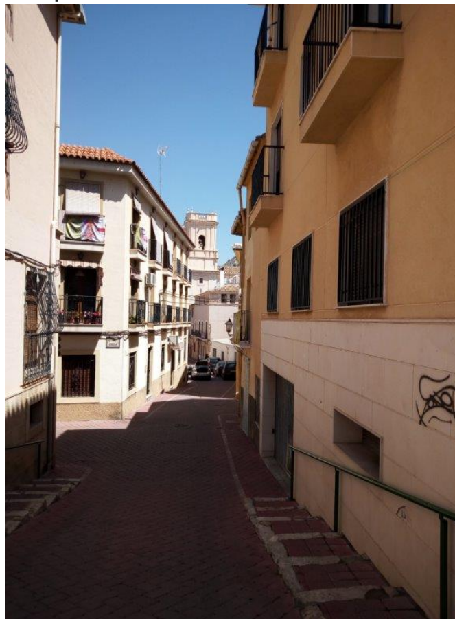
Una de las gestas de Jaumet fue lanzar una naranja desde la esquina del bar de la plaça de Dalt y pasarla por encima del campanario de la iglesia de San Bartolomé.

Jaumet murió el 10 de septiembre de 1915, a los 59 años de edad, después de haber ganado multitud de partidas y convertirse en una leyenda en el mundo de la pelota valenciana.