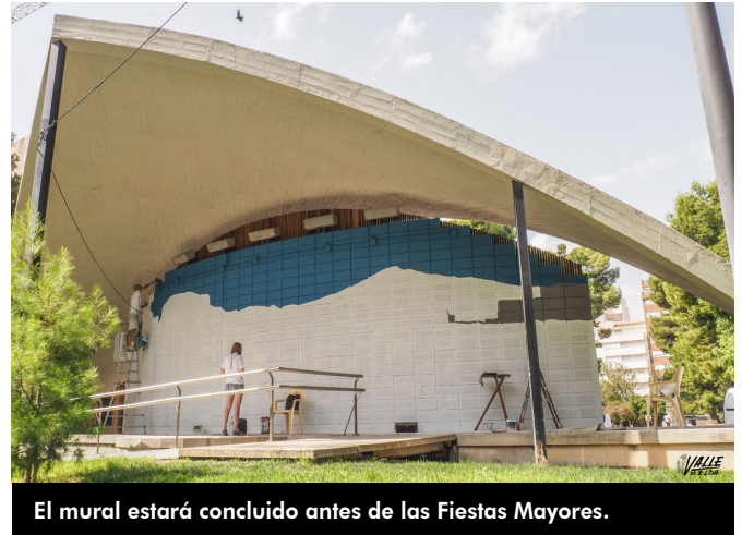
El mural estará concluido antes de las Fiestas Mayores.

Comenzaron ayer a trabajar y el diseño estará concluido antes de las Fiestas Mayores.