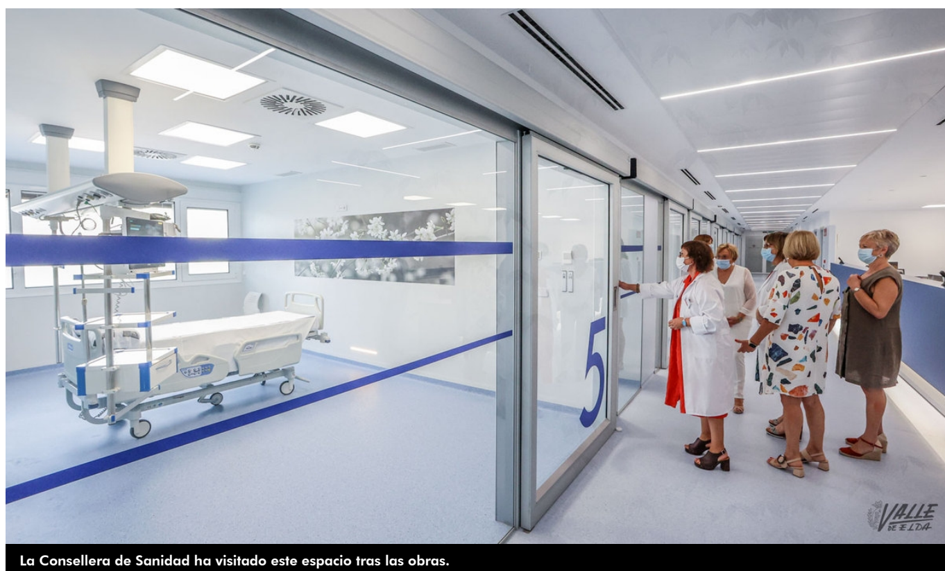
La Consellera de Sanidad ha visitado este espacio tras las obras.