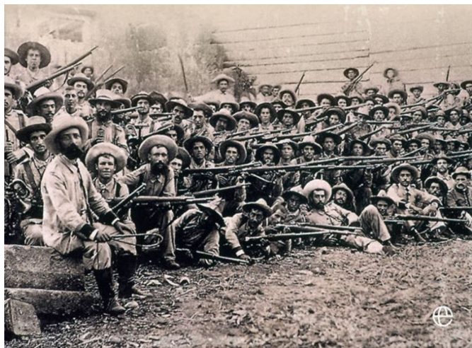
Soldados españoles durante la guerra de Cuba (1895-1898).