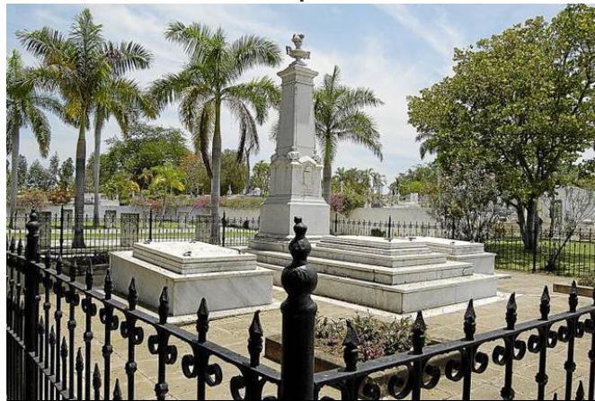
Mausoleo del cementerio de Santa Ifigenia, en Santiago de Cuba, donde reposan los restos de 226 soldados españoles de identidad desconocida.