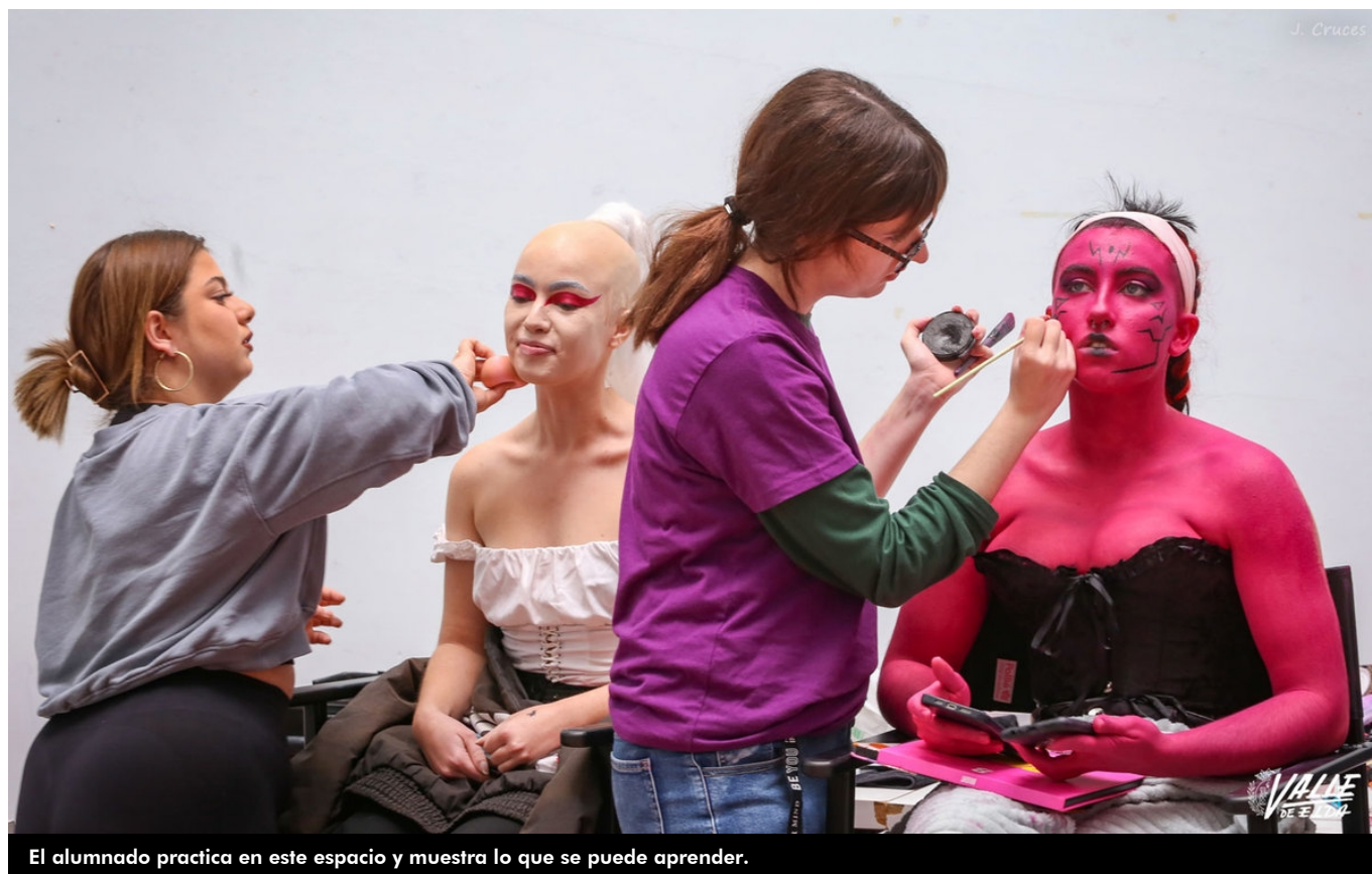
El alumnado practica en este espacio y muestra lo que se puede aprender.

El Baúl del Estudio y del Empleo ha arrancado hoy en el Centro Cívico y la Plaza de la Ficia con éxito. Más de medio centenar de centros educativos no solo de Elda sino de la provincia participan en este evento con la única intención de que los jóvenes conozcan las oportunidades laborales y profesionales de cara a su futuro.