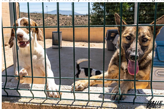
La protectora necesitaría que se haga un mantenimiento de las instalaciones | Nando Verdú.

El horario del albergue es de lunes a viernes de 10 a 13:30 horas, y por las tardes a partir de las 17 horas con cita previa , pero las donaciones se pueden dejar en la puerta a cualquier hora y los trabajadores las recogen.