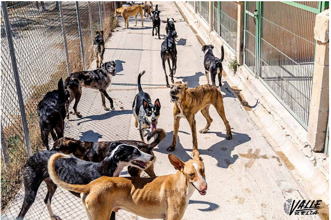
Centenares de perros buscan un nuevo hogar