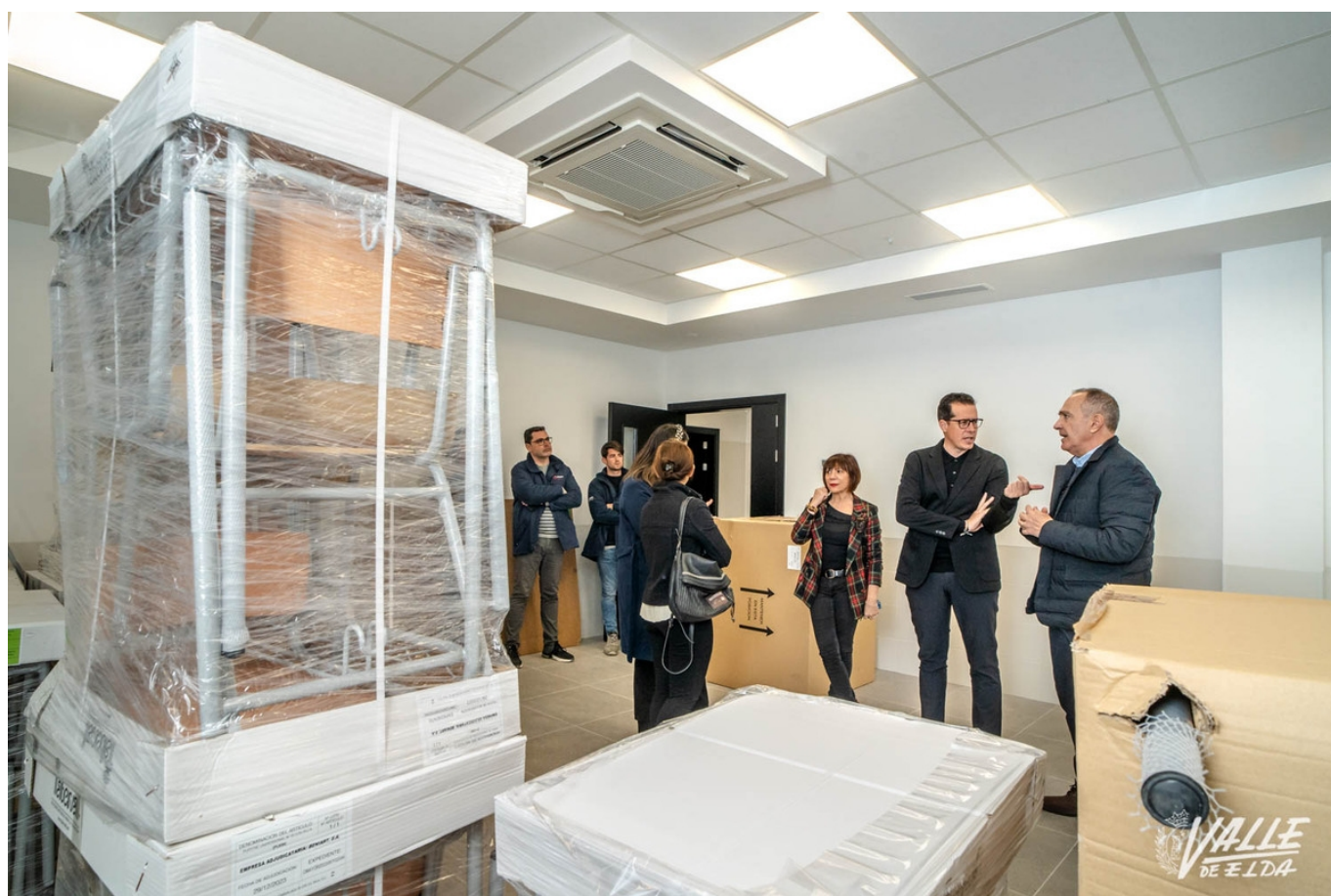
El centro cuenta con siete nuevas aulas | Nando Verdú.

El Instituto Monastil está de enhorabuena. Las nuevas obras valoradas en cerca de 1'3 millones de euros del Plan Edificant han concluido. El centro ha visto ampliadas sus instalaciones con un pabellón de 500 metros con siete nuevas aulas de gran tamaño, y se han instalado placas fotovoltaicas para buscar el casi total autoconsumo energético.